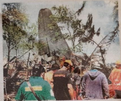
▲ Hulpverleners zijn bij de plaats van het ongeluk.

Een militair vliegtuig is gisteren bij de landing op het vliegveld van het eiland Jolo gecrasht, meldt het Filipijnse leger. Daarbij zijn zeker 45 mensen omgekomen, onder wie burgers die niet in het vliegtuig zaten. Het ministerie vreest dat er nog meer inzittenden zijn overleden, omdat nog 17 mensen vermist worden. Ook vielen er 50 gewonden. Aan boord zaten waarschijnlijk iets minder dan 100 personen. Daarover verschillen de berichten. Aanvankelijk spraken de autoriteiten van 85 mensen, andere